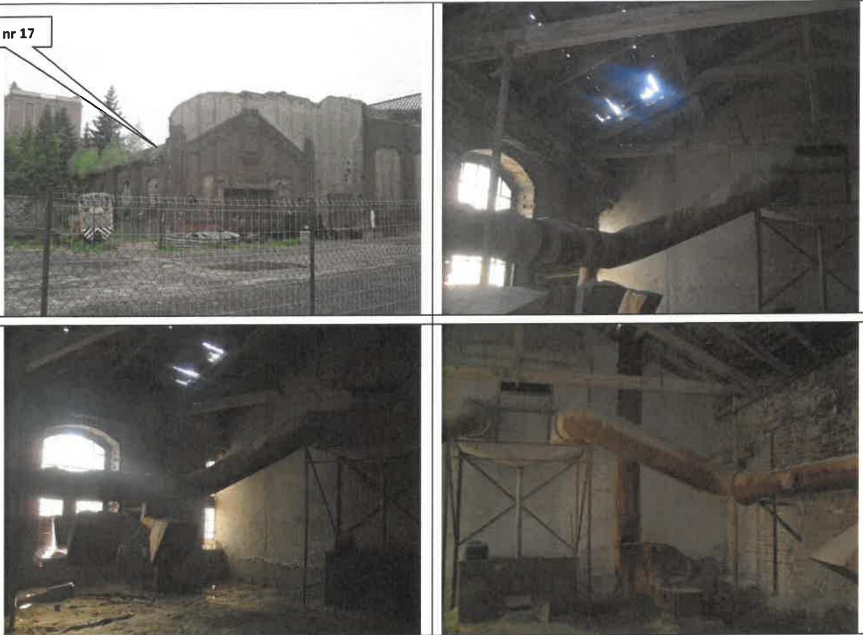
Obiekt nr 17