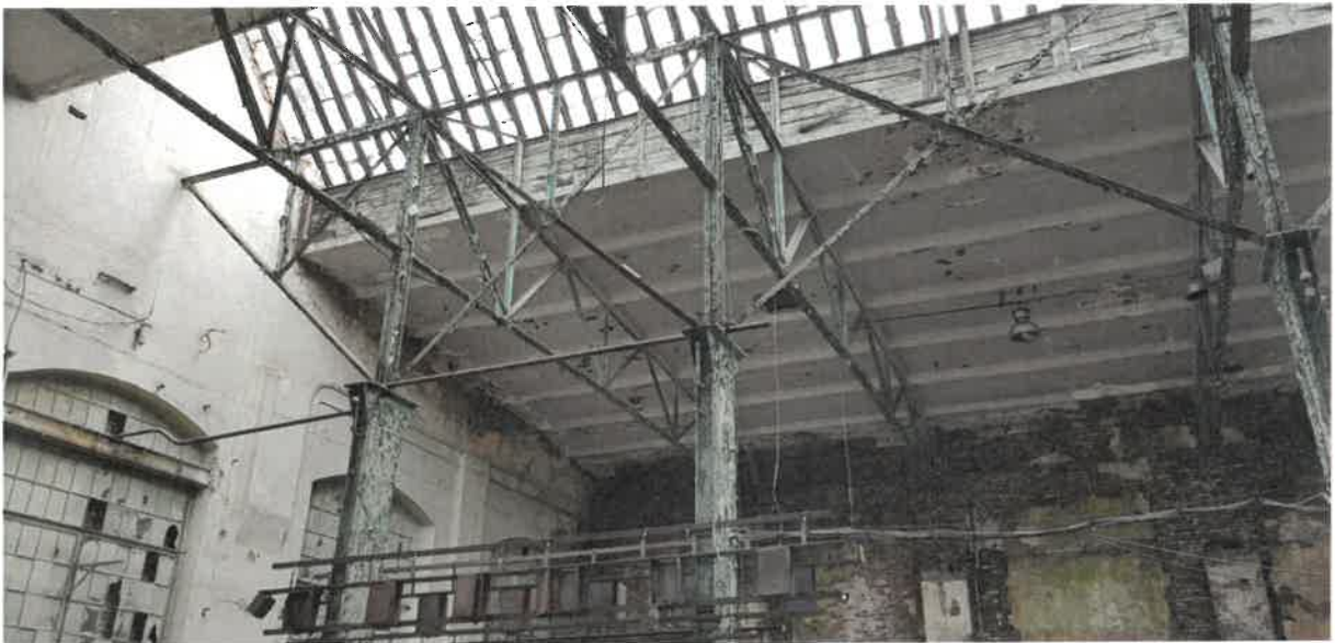
Budynek H1 - widok dachu od wewnątrz