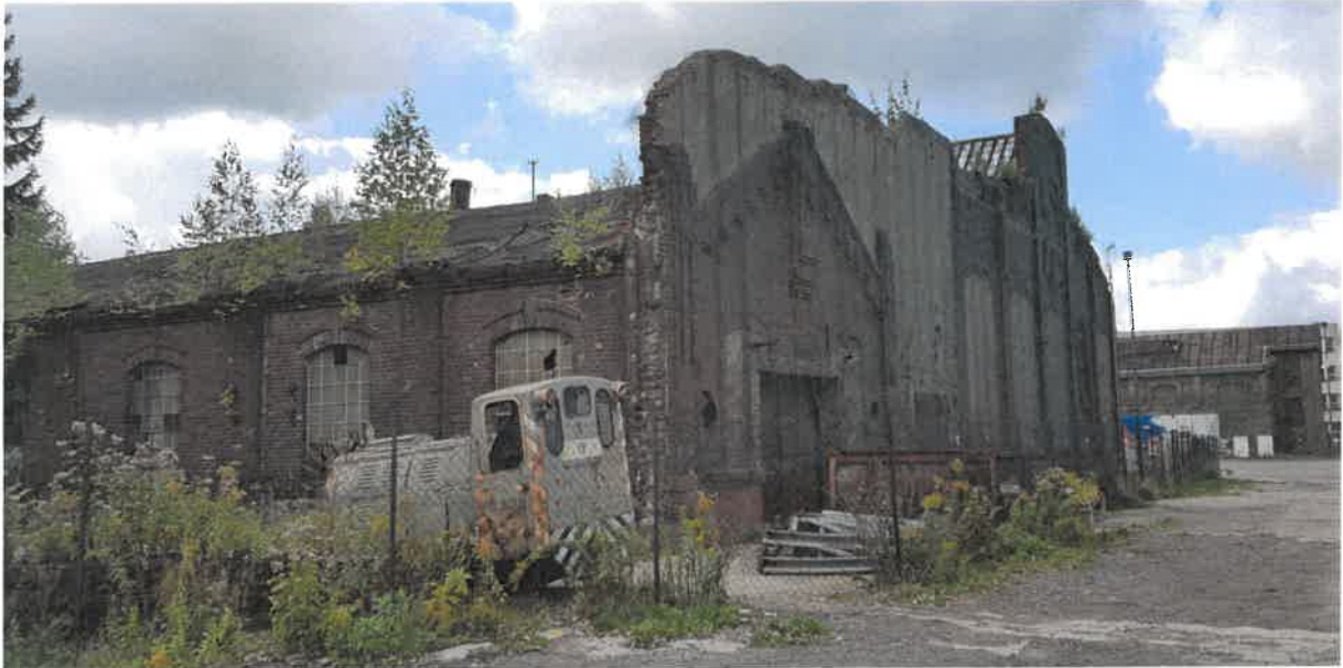
Budynek H1 - widok z zewnątrz