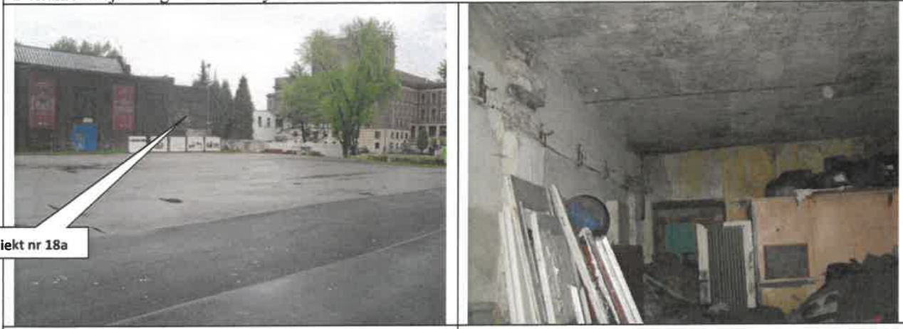
Obiekt nr 18a

Dokumentacja fotograficzna budynku nr 18a: